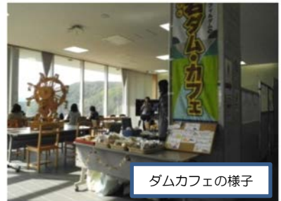
ダムカフェの様子