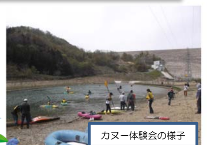
カヌー体験会の様子