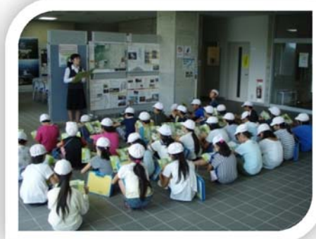
9/9 奥州市立常盤小学校の皆さん