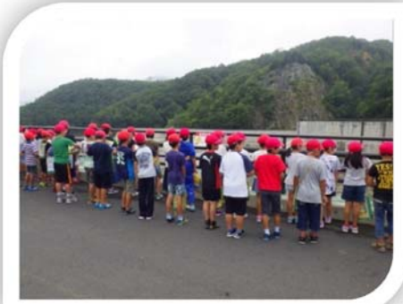
9/5 奥州市立前沢小学校の皆さん