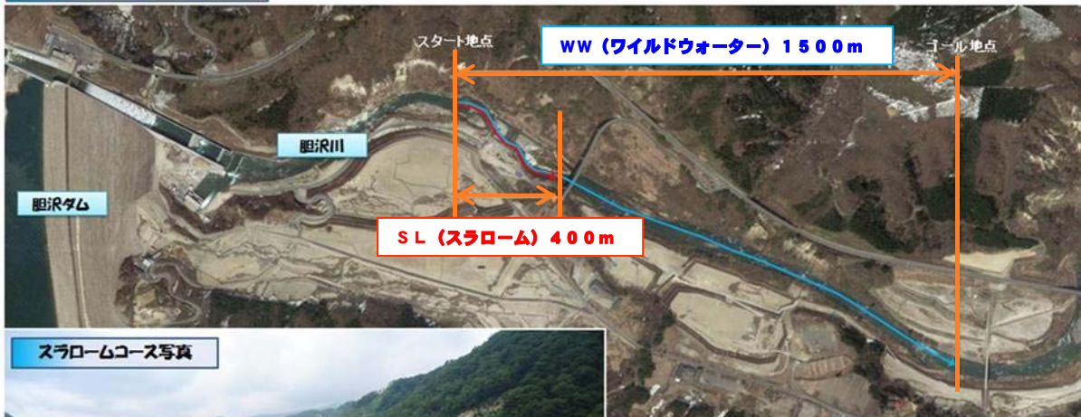
スラロームコース写真