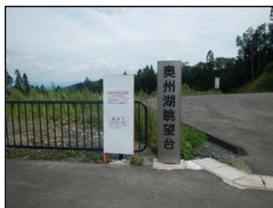
眺望台からは胆沢ダム堤体も見えます