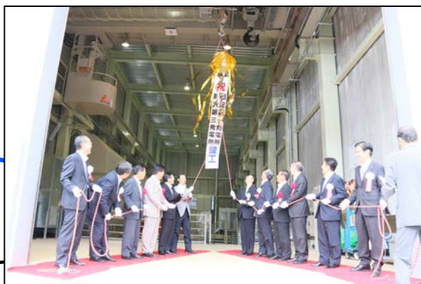
くす玉を割り、発電所の完成を祝いました

竣工式では関係者約80人が出席しました。再生可能エネルギーが注目されている中、ダムの貯水を利用する水力発電設備に期待が込められていました。