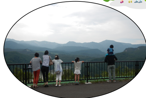
お盆期間ということもあり、子供や孫を連れて景色を楽しんでいた方が多かったです