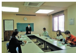
4月21日の幹事会の様子

※春季統一清掃の詳細については5月18日(木)の総会にて決定後、関係機関や各団体へ文書でお知らせしますので、皆様のご協力をよろしくお願いたします。