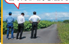
令和4年度ダム警報訓練の様子

御所ダムでは6月15日(木)、大規模洪水を想定した「ダム警報訓練」を実施します。