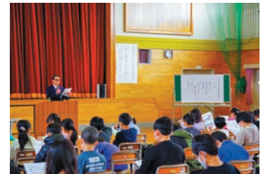
真剣に聞き入る太田小児童のみなさん