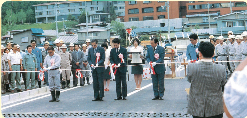
つなぎ大橋のテープカット