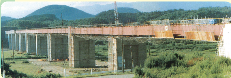
建設中のつなぎ大橋