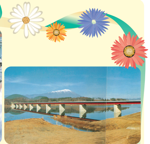
完成したつなぎ大橋