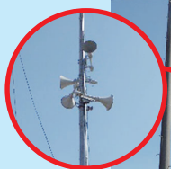
スピーカー増設 【2基⇒4基】