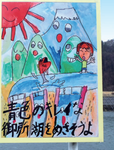
ダム下流右岸 (御所発電所側)