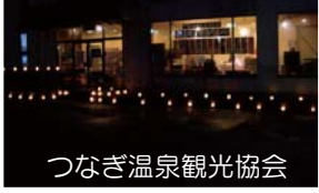
つなぎ温泉観光協会