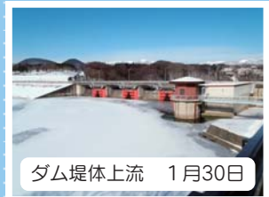
ダム堤体上流 1月30日

1月中旬、厳しい冷え込みが続き、御所湖も結氷が確認されました。氷は融氷結氷を繰り返す、非常に不安定で大変危険ですので湖面へは絶対立ち入らないようにして下さい。