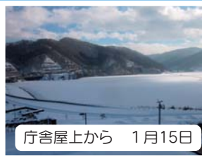
庁舎屋上から 1月15日