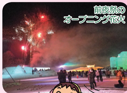
前夜祭の オープニング花火