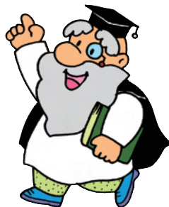
きれいな御所湖を

国土交通省では河川環境の基礎情報を目的に、平成2年度から「河川水辺の国勢調査」を実施し、生物や河川空間の利用、ダム湖利用実態などについて調査しています。22年度は、陸上昆虫類等の調査を行いました。ダム湖周辺において春季、夏季、秋季の3回、捕獲や目撃などで調査をしました。調査の結果、陸上昆虫類等が重要種22種を含む1,803種が確認され、前回に比べ280種程度多く確認されています。ごしょこものしり館・防災センターに、今回の調査で捕獲された昆虫の標本を展示していますので、ぜひ一度ご覧ください。