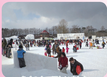
多くの方で賑わいました

いわて雪まつりは、“見て、ふれて、遊ぶ、いわての冬”をコンセプトに開催され、滑り台や馬そり、花火やライブなど、さまざまな催しが行われたほか、ご当地グルメが集まった屋台村も設置され、多くの方々に賑わいました。前夜祭では、オープニング花火が打ち上げられたほか、雪像がライトアップされ、