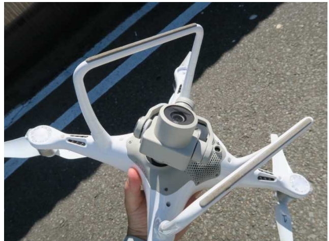
▲所在が不明になったドローン 回収完了 (破損状況: 破損なし)