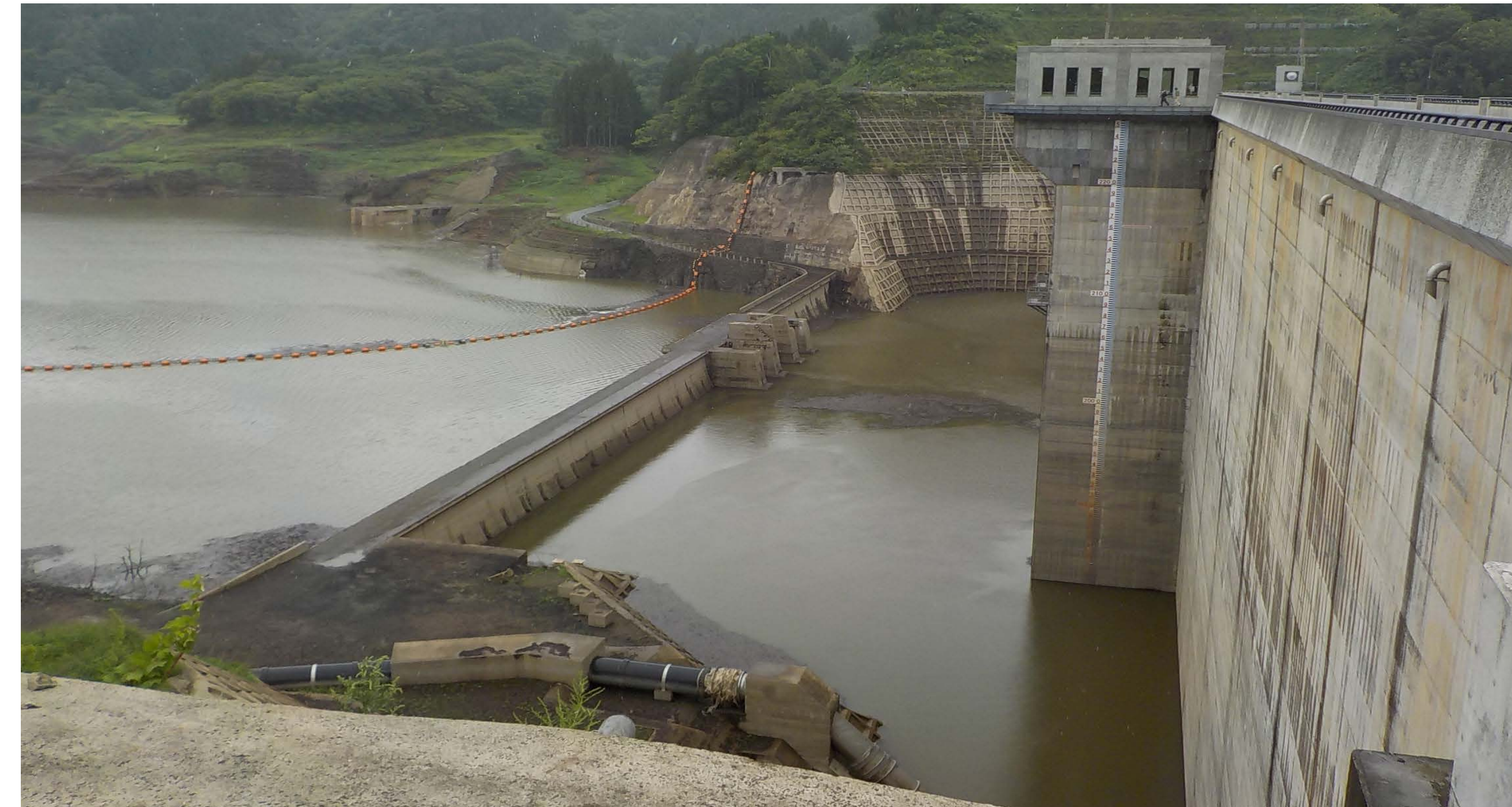
■ 貯水位が回復した津軽ダム (R元. 8. 23 12時頃撮影)