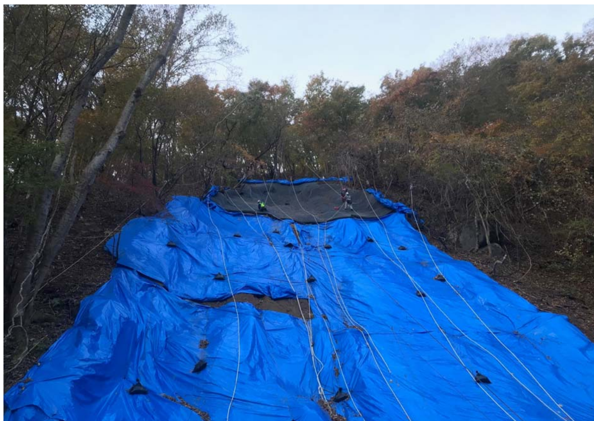
相馬福島道路(9.75kp(下り)) 法面崩落箇所 応急復旧工事状況 令和元年11月15日