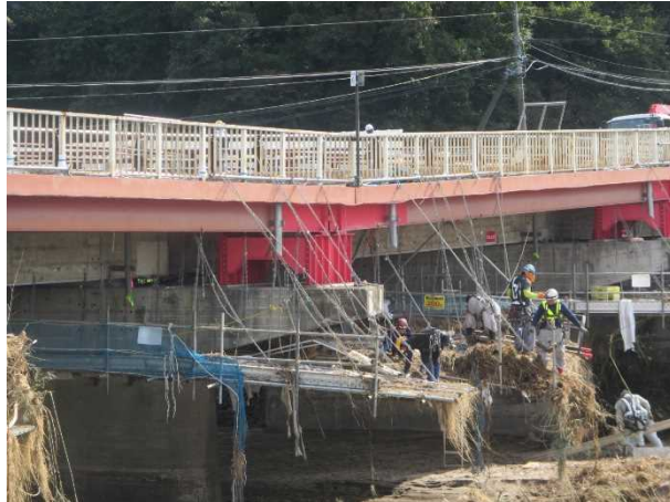
令和元年10月17日の状況