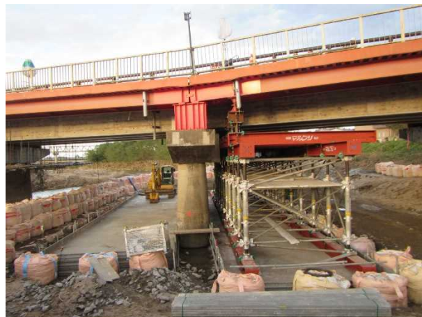
令和元年10月24日の状況