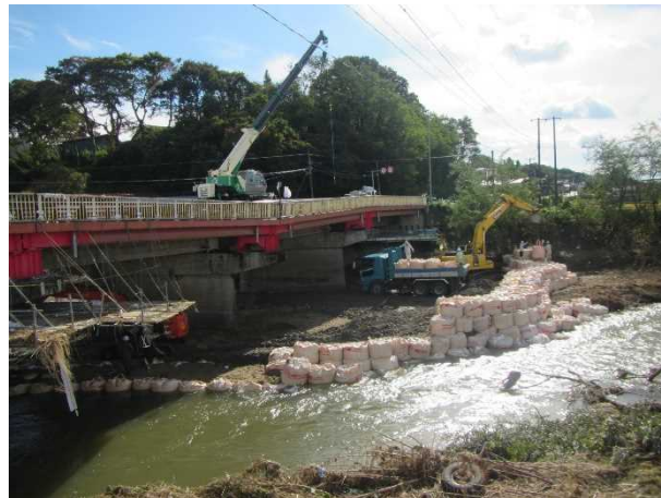
令和元年10月20日の状況