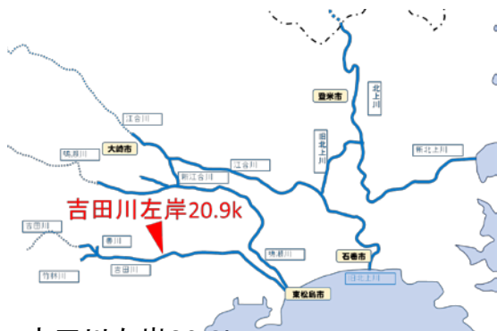
吉田川左岸20.9k 宮城県黒川郡大郷町粕川字伝三郎地先