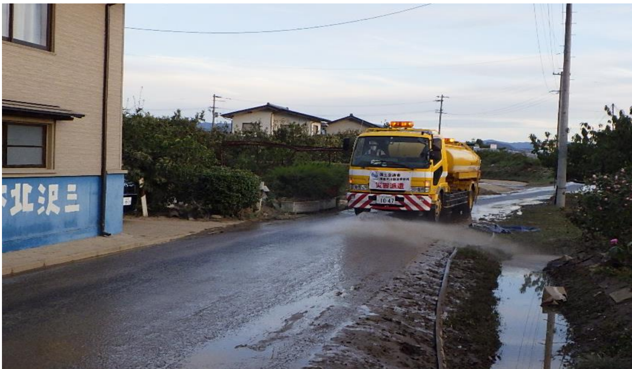
災害対策車両による、桑折町内に流入した土砂の撤去作業実施状況 令和元年10月17日 (於：伊達郡桑折町地内)