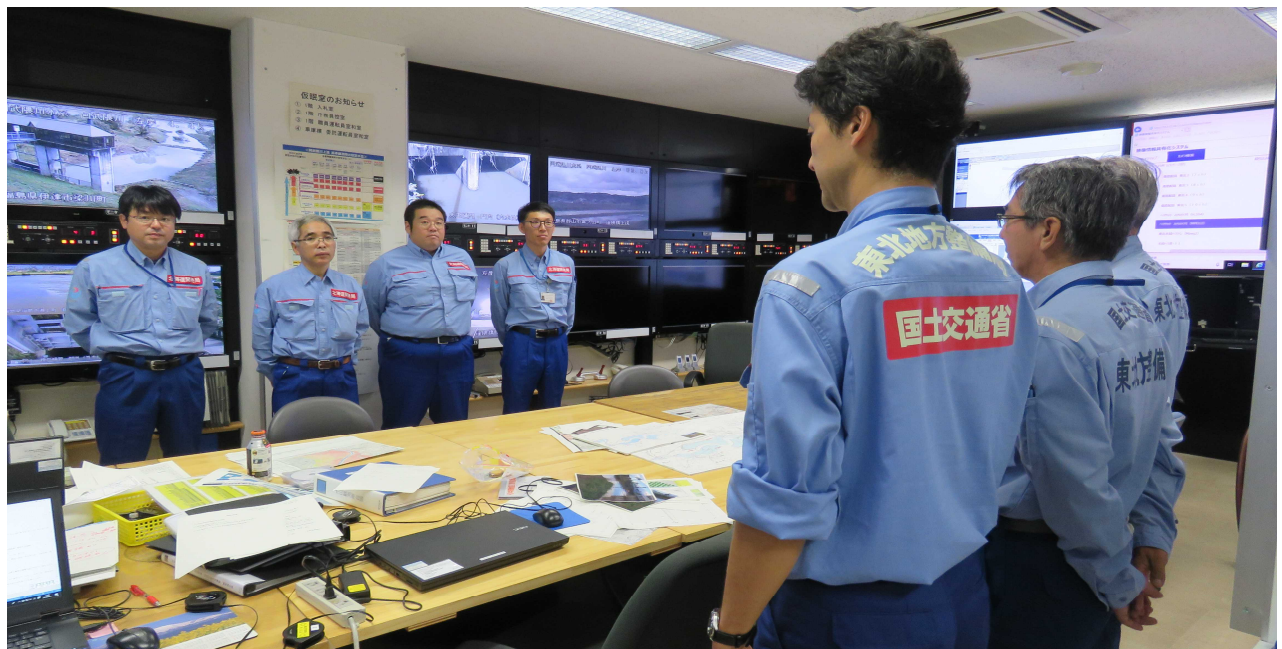
北海道開発局よりTEC-FORCE到着 令和元年10月15日 (於 福島河川国道事務所)