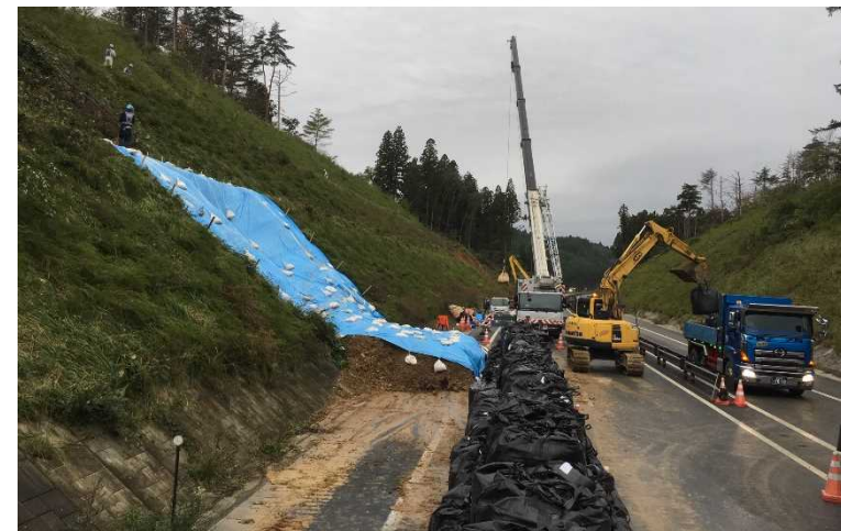
△E45三陸沿岸道路 (三滝堂～志津川) 間