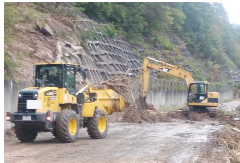
△国道49号 郡山市栃本地内