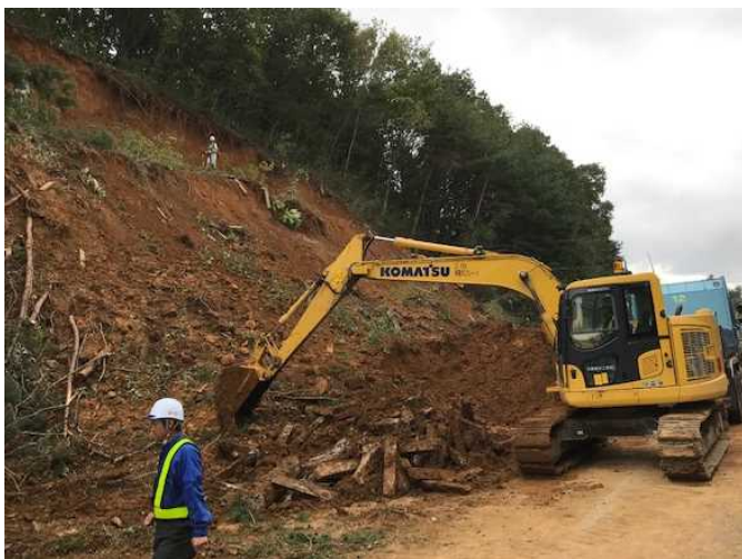
△国道4号 福島市伏拝地内