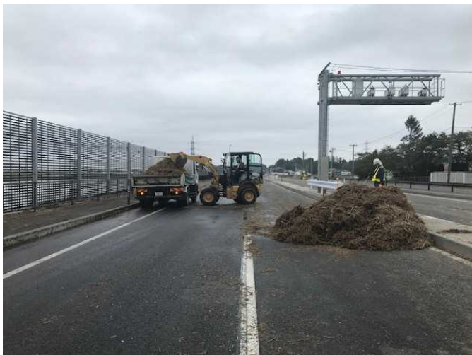
△国道4号 大崎市三本木地内