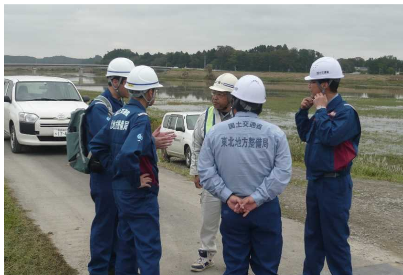
現地における打合せ