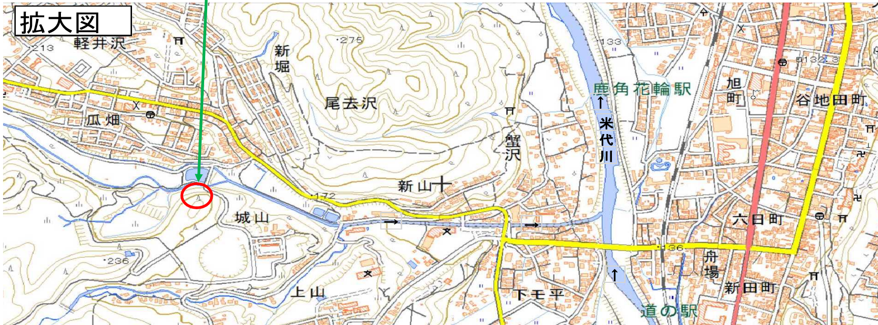
この地図は、国土地理院長の承認を得て、同院発行の電子地形図(タイル)を複製したものである。(承認番号平30東複、第23号)