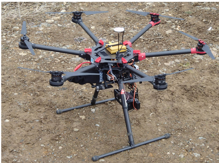
所在がつかめなくなっているドローン(実物)