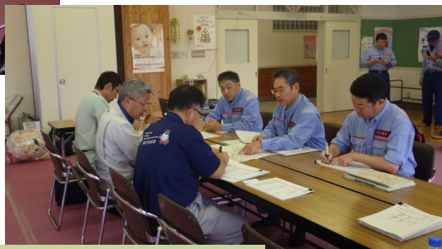
宮古市に被災調査結果報告(岩手県宮古市)