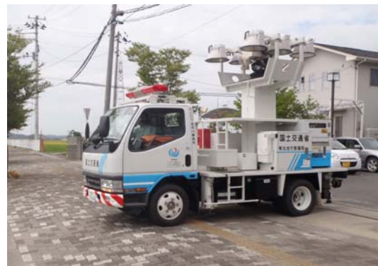
写真 災害対策派遣車両の出発時状況