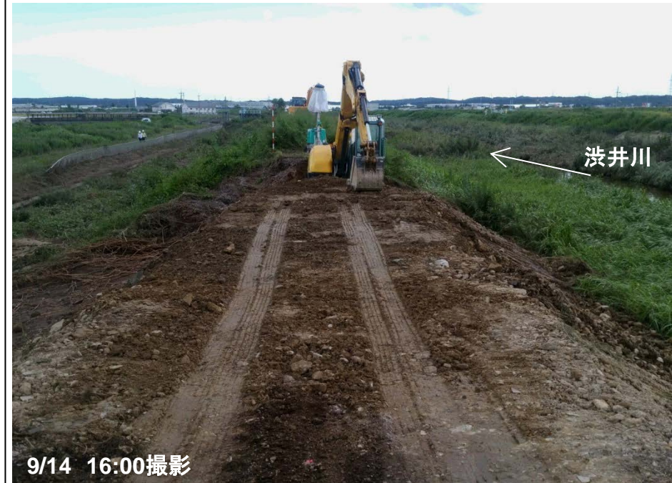
西荒井中流工区 復旧状況