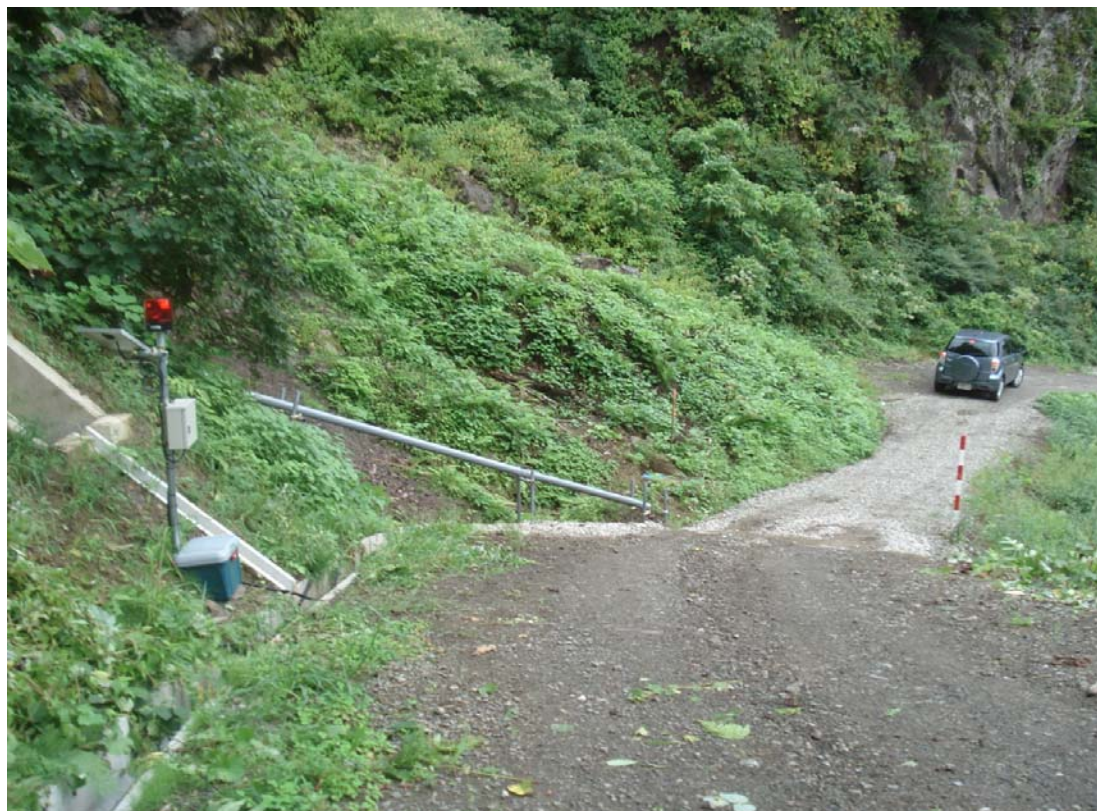
※地盤伸縮計、回転灯の設置状況