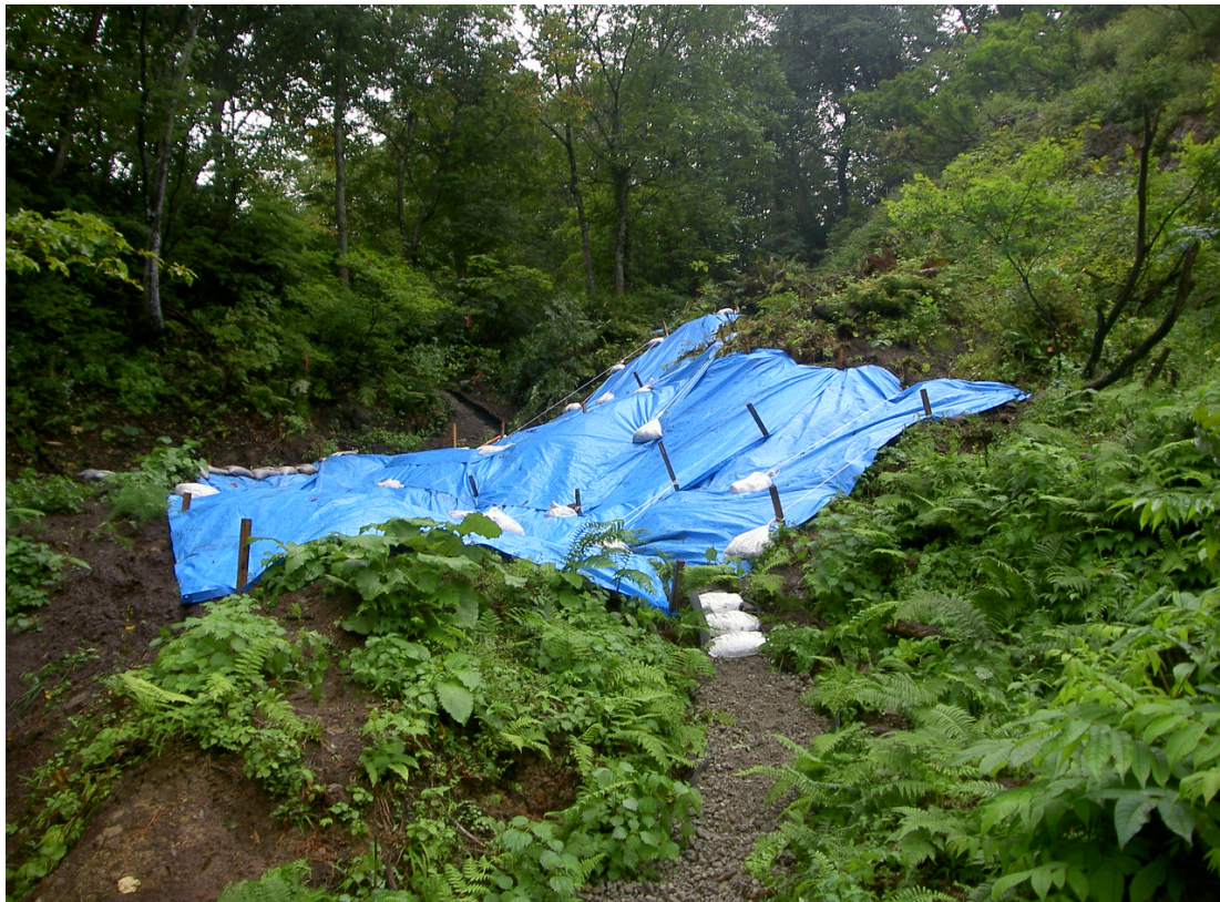
※シート養生の施工状況