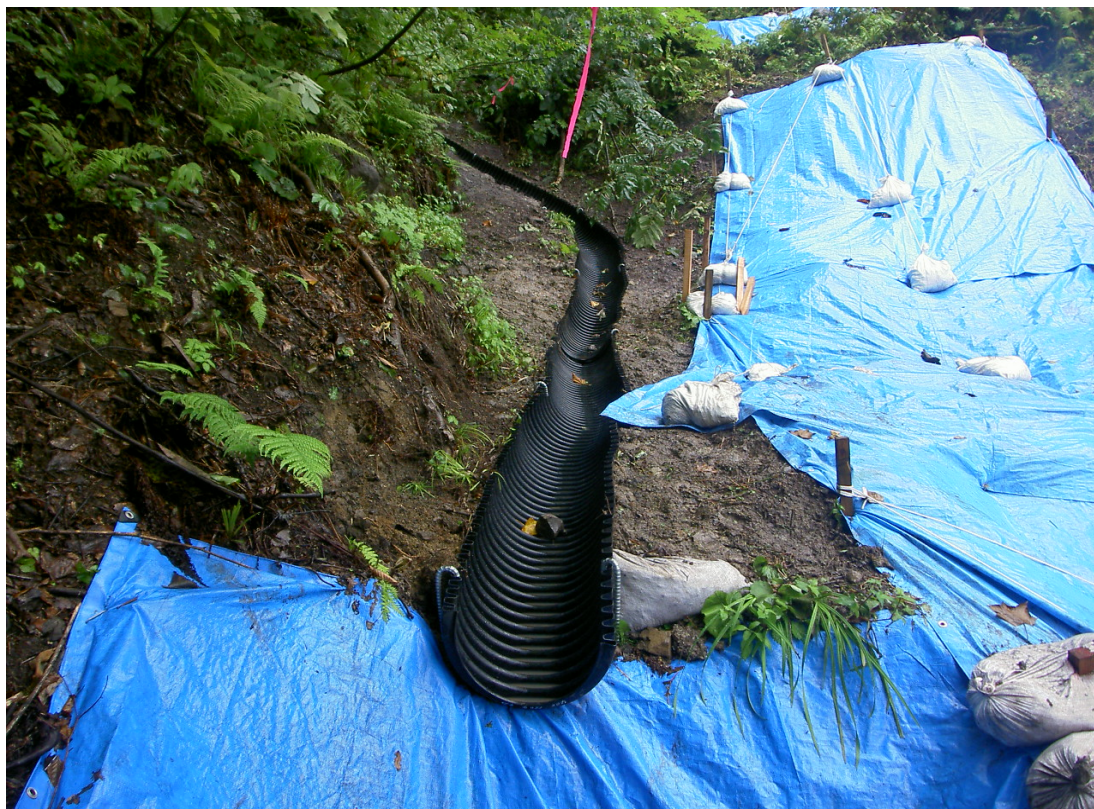
※排水工の施工状況