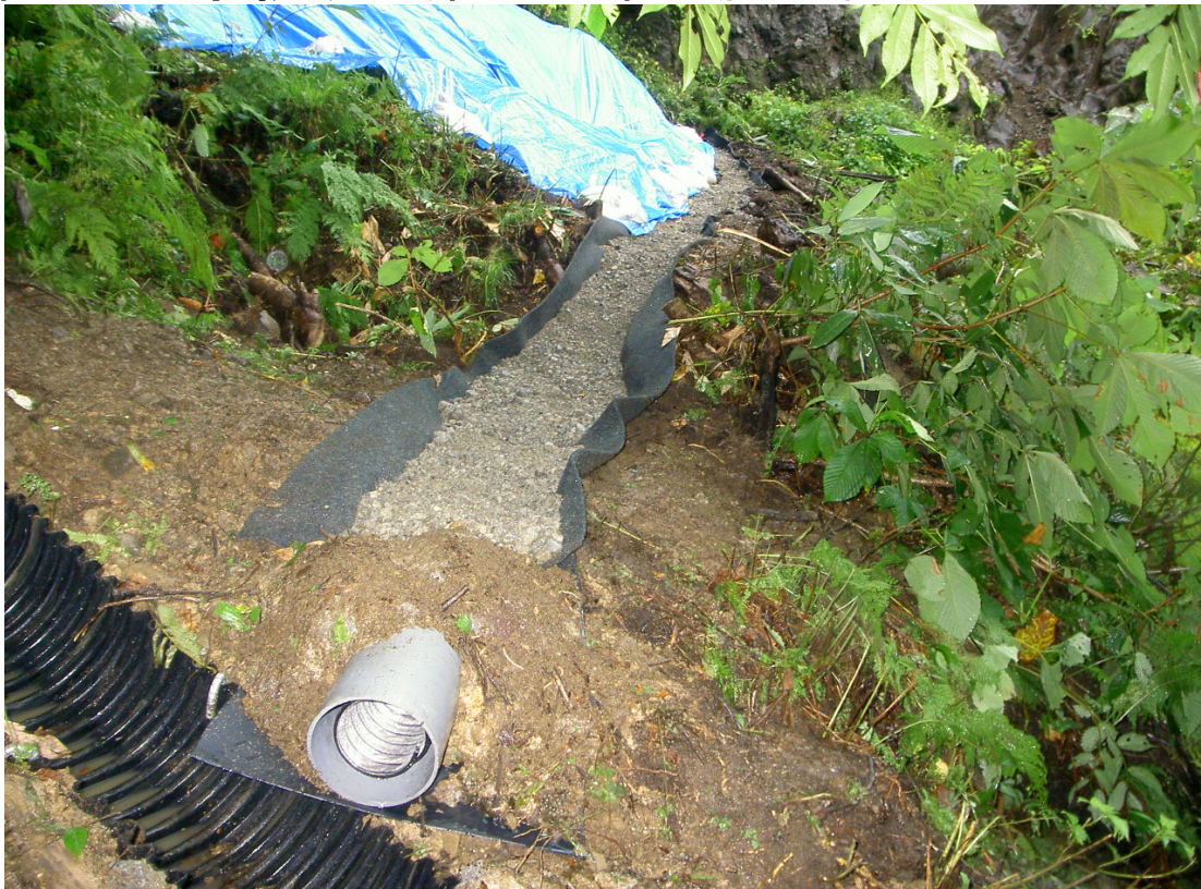
※暗渠工の施工状況