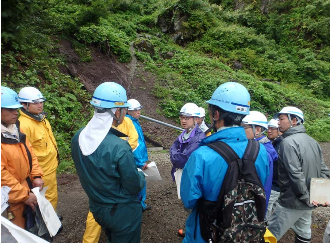
※田村事務所長(専門家)による現地調査の実施