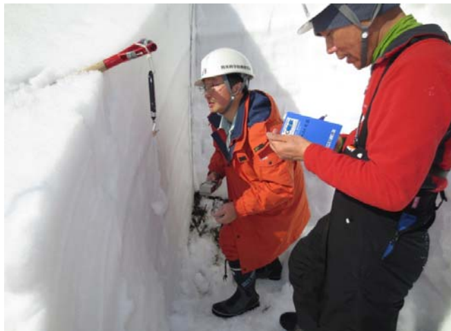
▲専門家による現地調査実施状況②