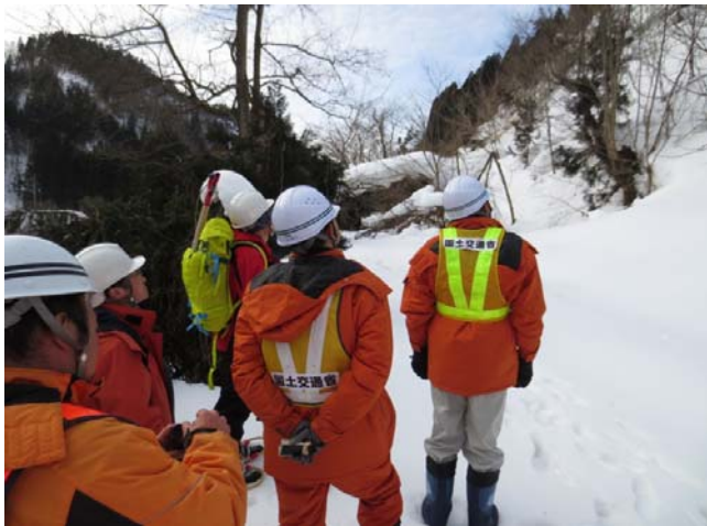
▲専門家による現地調査実施状況①