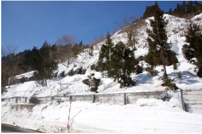
▲雪崩発生箇所の法面状況