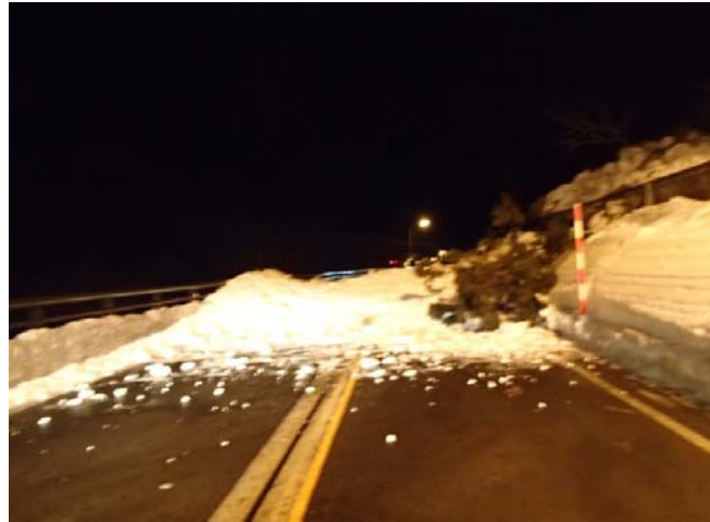
▲雪崩直後の道路状況