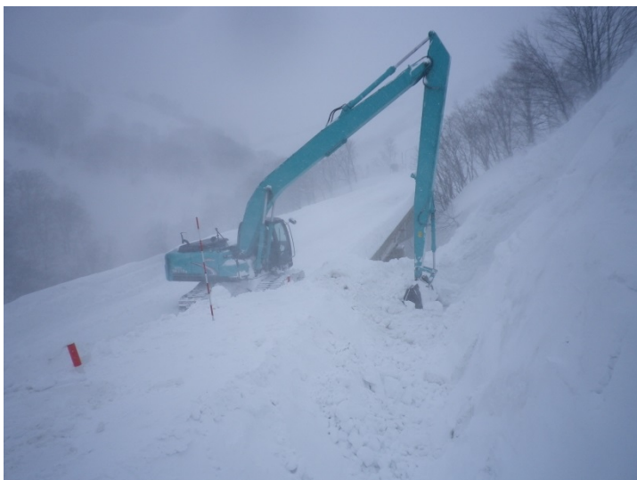
雪崩発生箇所の雪堤および導流路の設置作業