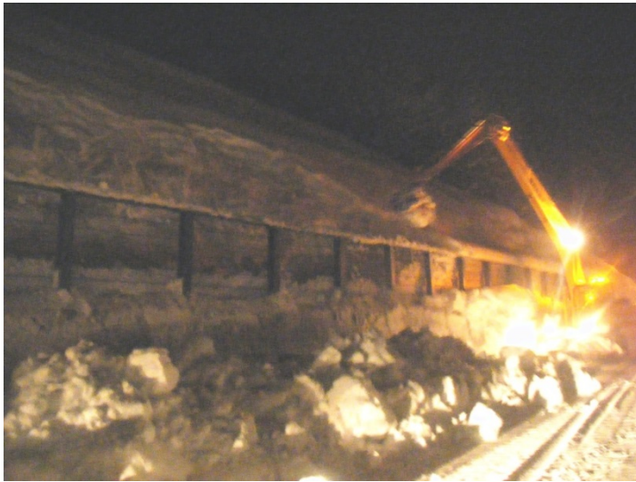
雪崩柵背面の堆雪スペース確保作業