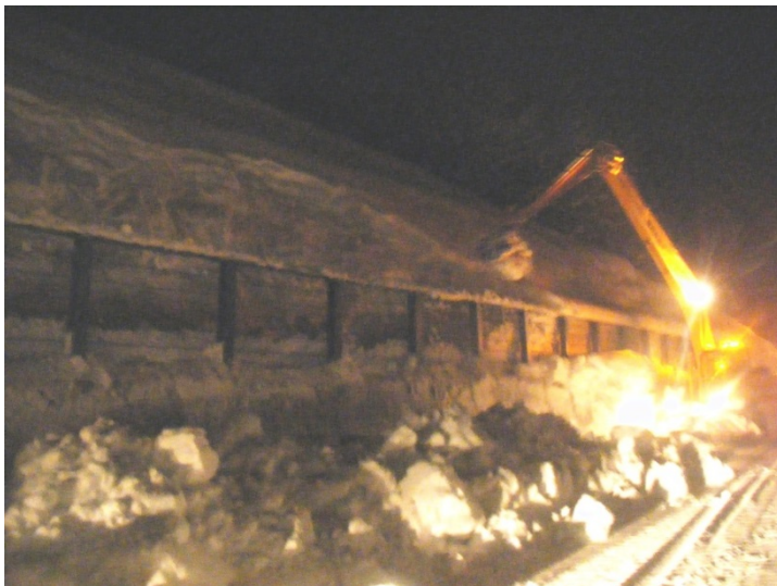
雪崩柵背面の堆雪スペース確保作業