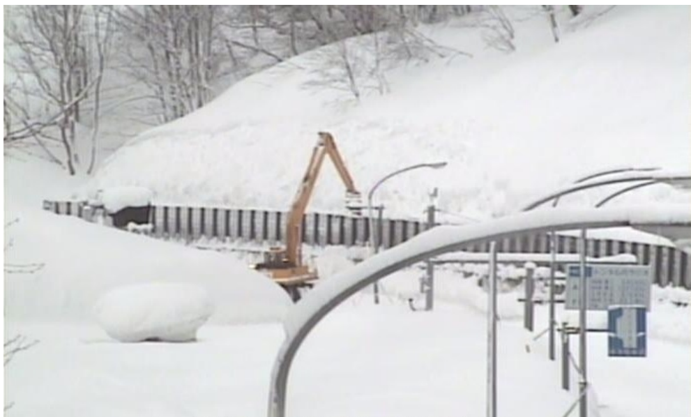
雪崩柵背面の堆雪スペース確保作業