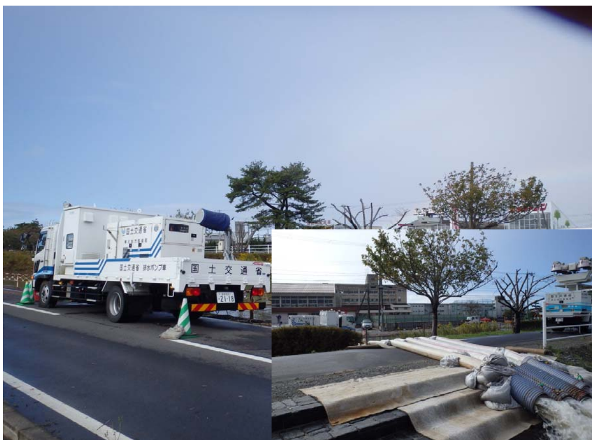
横堤ポンプ場（石巻市貞山地内）【排水ポンプ車30m 3 /分】