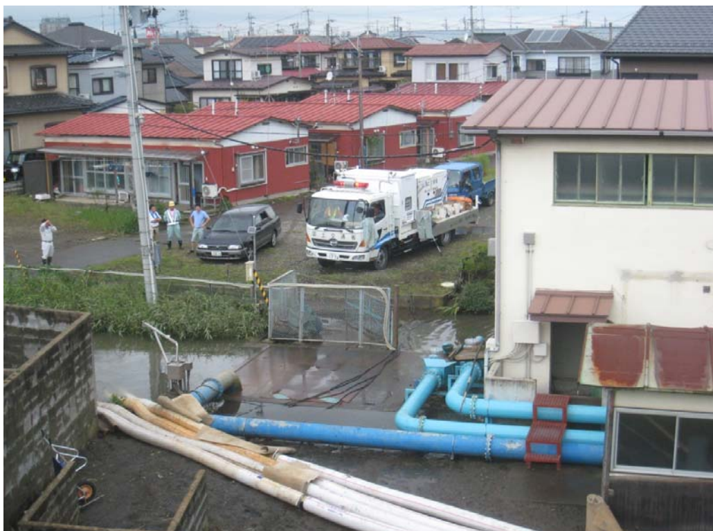
眼鏡筒ポンプ場（石巻市蛇田地内）【排水ポンプ車30m 3 /分】