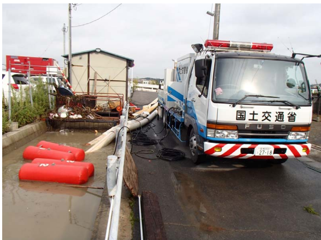
不動沢第2ポンプ場（石巻市不動町地内）【排水ポンプ車30m 3 /分】