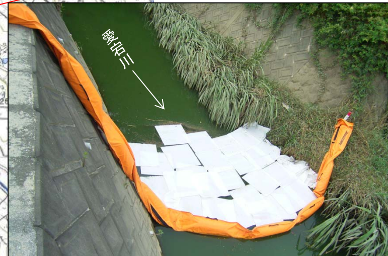
オイルフェンス設置状況