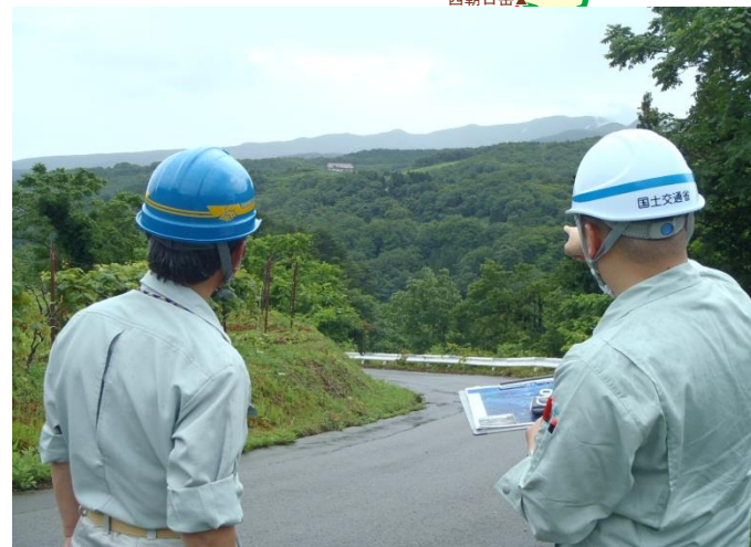
【田麦俣地区点検状況】