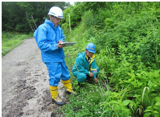
【志津地区点検状況】