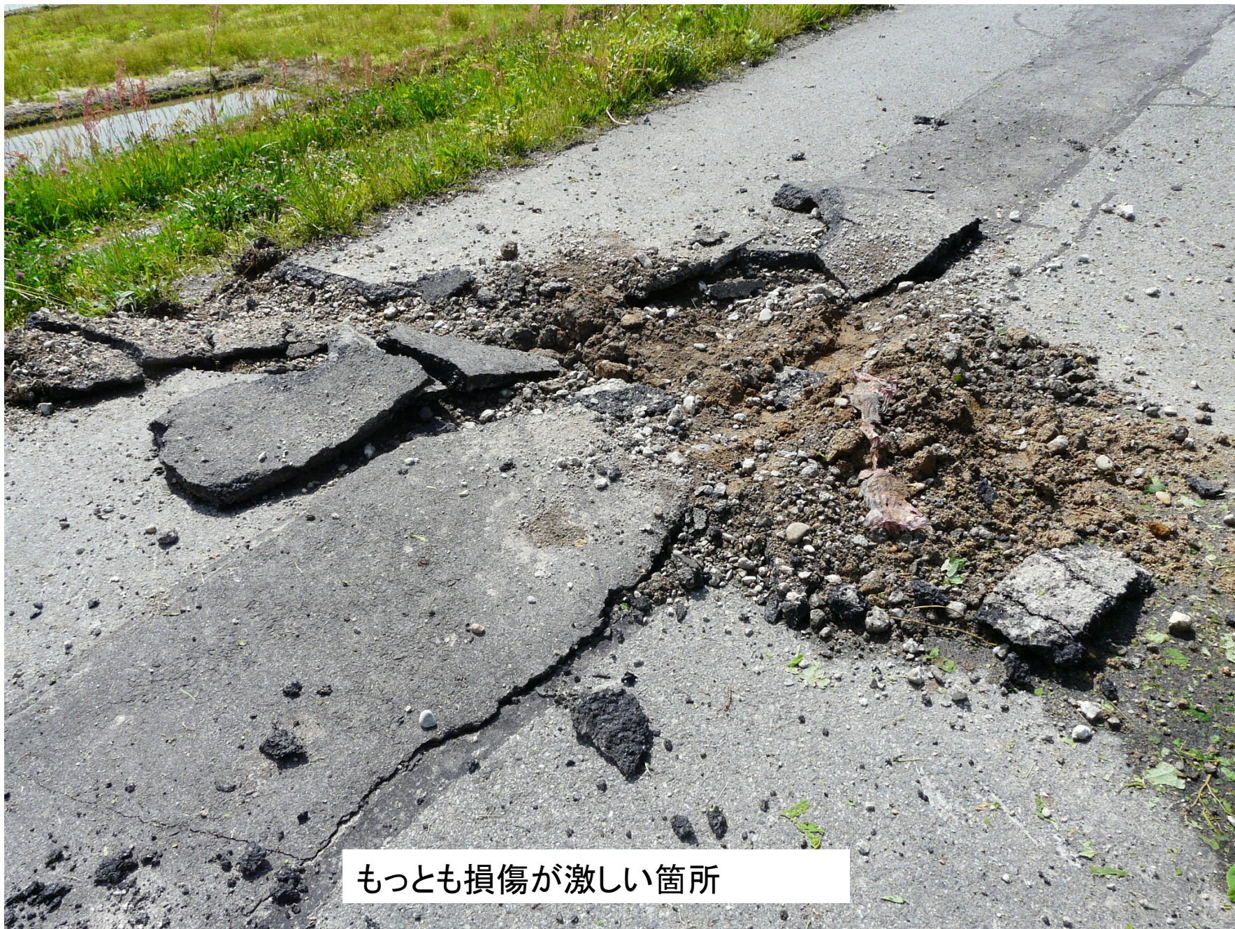
もっとも損傷が激しい箇所