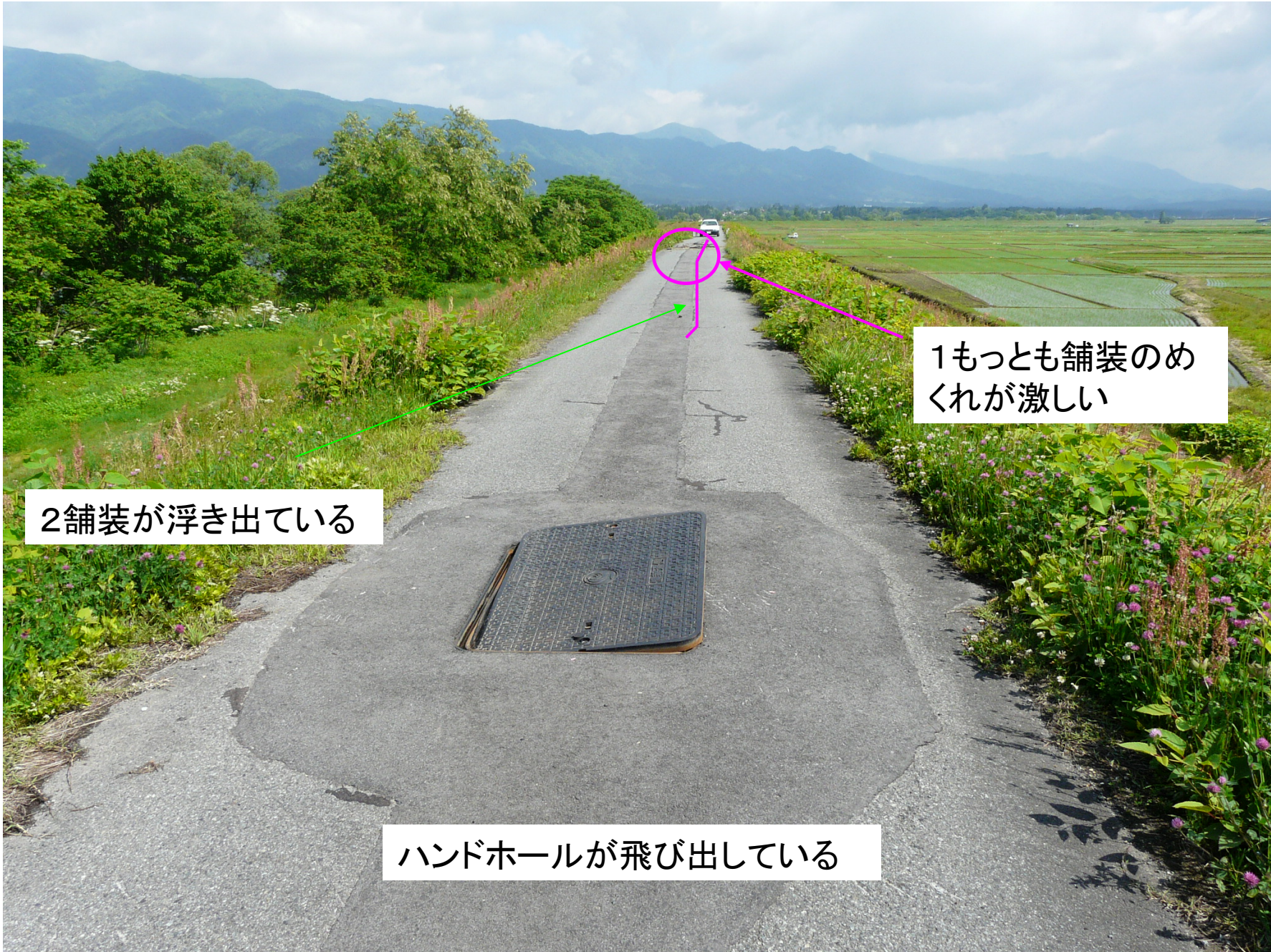
2舗装が浮き出ている