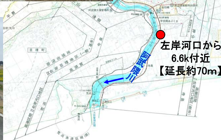
左岸河口から 6.6k付近 【延長約70m】