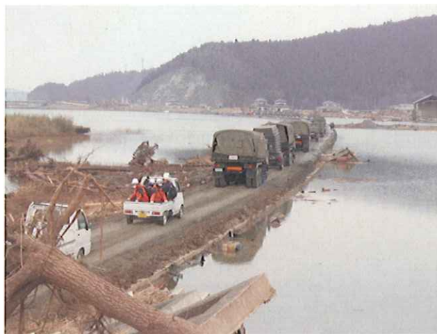
幅員 4 m での供用（3月22日）