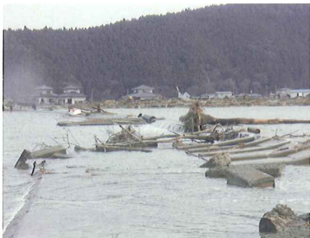
道路兼用河川堤防の流出