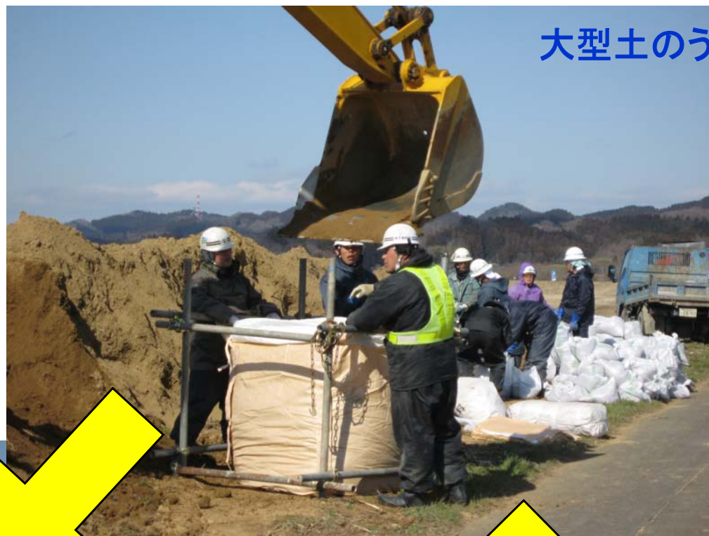
大型土のう製作に着手