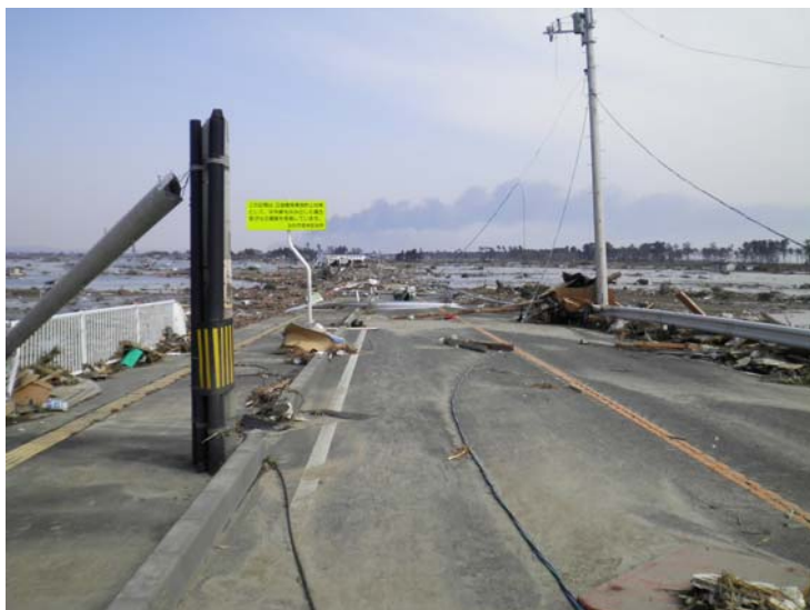
写真⑲ 現地状況 (河口から左岸1.0k付近 仙台市若林区藤塚地先)