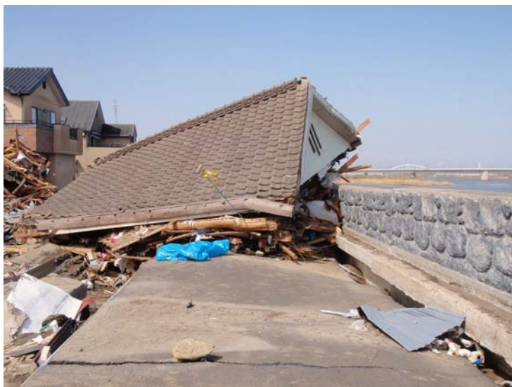
写真⑬ 現地状況 (河口から右岸0.6k付近 名取市閑上地先)