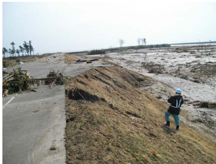
写真⑱ 現地状況 (河口から左岸0.8k付近 仙台市若林区日辺地先)