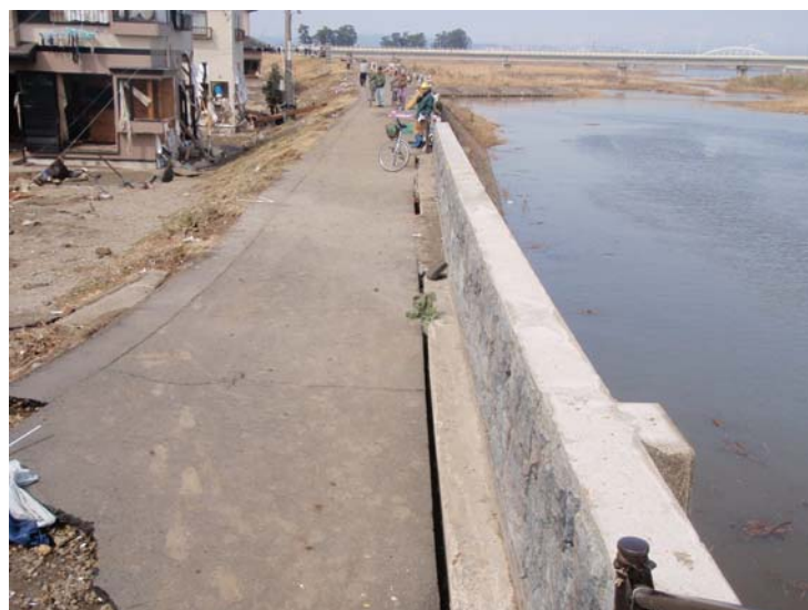
写真⑮ 現地状況 (河口から右岸0.8k付近 名取市閑上地先)