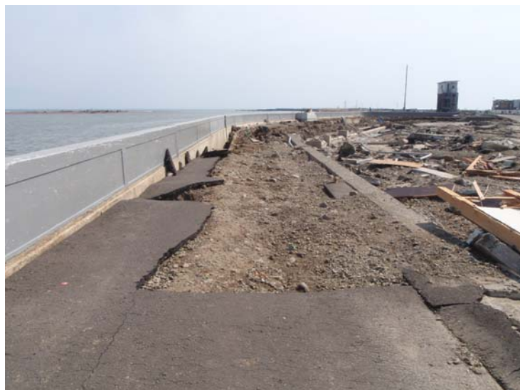
写真⑪ 現地状況 (河口から右岸0.4k付近 名取市閑上地先)