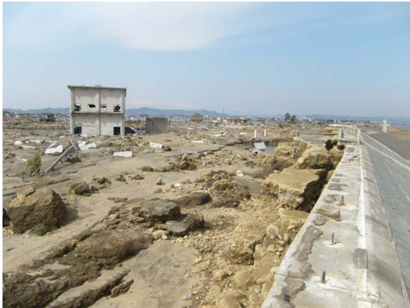
写真⑦ 現地状況(宅地側) (河口から右岸-0.1k付近 亶理町荒浜地先)