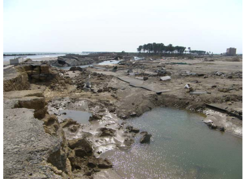
写真⑥ 現地状況(宅地側) (河口から右岸-0.1k付近 亶理町荒浜地先)