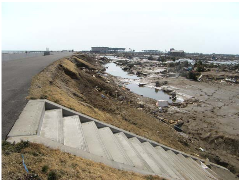
写真⑨ 現地状況(宅地側) (河口から右岸0.2k付近 亶理町荒浜地先)