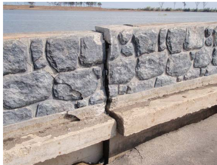
写真⑭ 現地状況 (河口から右岸0.6k付近 名取市閑上地先)