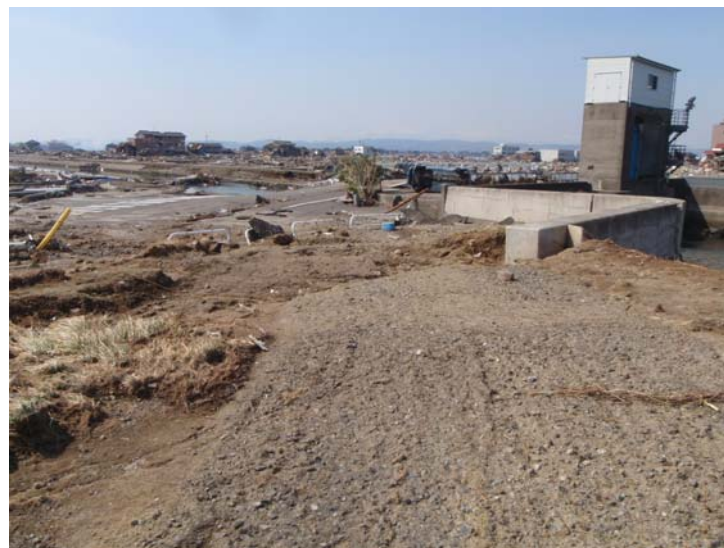
写真⑩ 現地状況 (河口から右岸0.0k付近 名取市閑上地先)