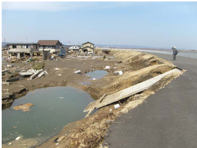
写真⑪ 現地状況(宅地側) (河口から右岸0.4k付近 亶理町荒浜地先)