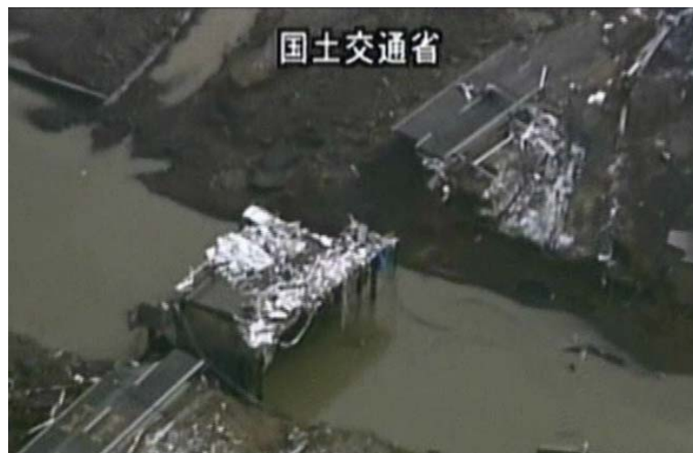
【写真④ 国道45号】(ヘリコプターによる上空画像) 背面盛土流失:二十一浜橋(本吉町二十一浜地内)