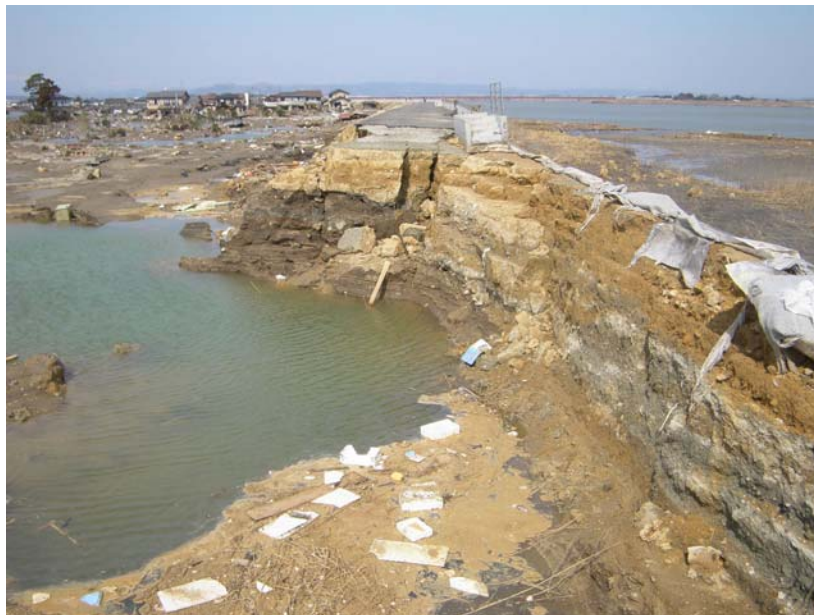
写真⑩ 堤防被害状況 (河口から右岸0.2k付近 亶理町荒浜地先)