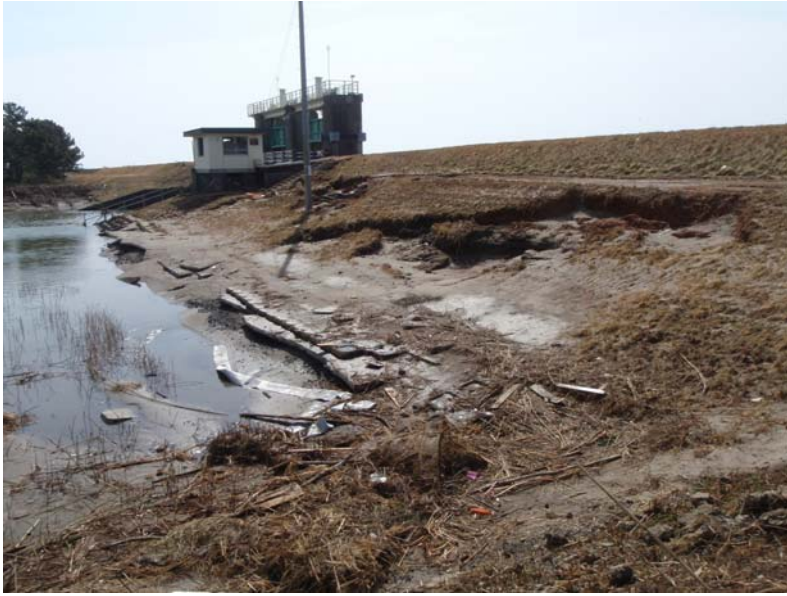
写真⑤ 法面崩壊 (河口から左岸0.5k付近 岩沼市寺島地先)