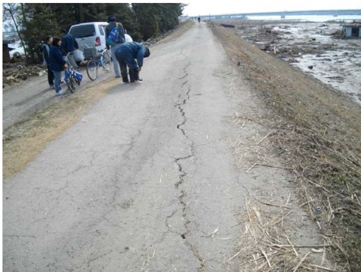
写真⑰ 現地状況 (河口から左岸1.8k付近 仙台市若林区日辺地先)