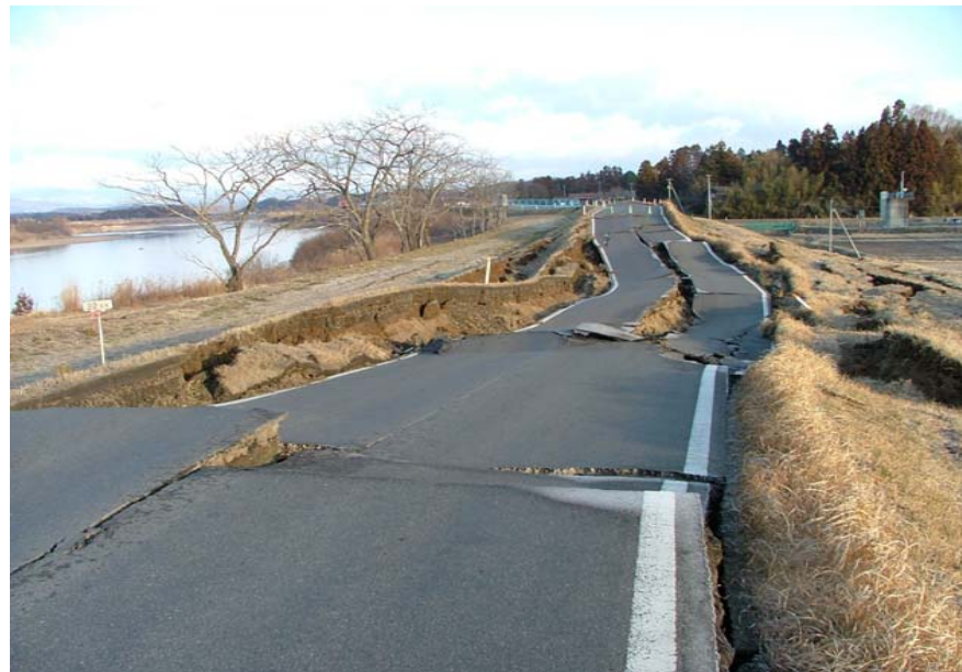
写真② 堤防沈下 (河口から右岸22.0k付近 角田市坂津田地先)