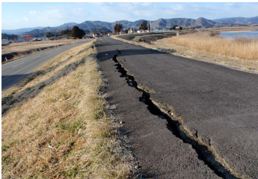
写真③ 堤防縦断亀裂(クラック) (河口から右岸31.0k付近 角田市堂畑地先)