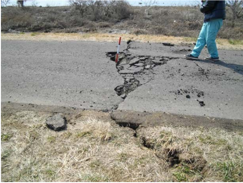
写真① 堤防亀裂 (河口から左岸2.8k付近 若林区今泉地先)