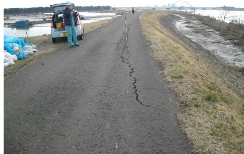
写真② 堤防亀裂 (河口から左岸2.7k付近 若林区今泉地先)