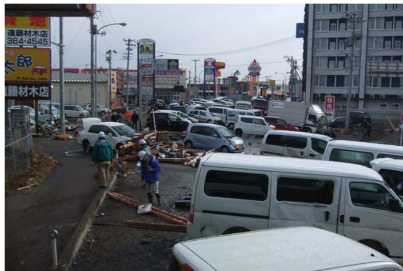
【写真② 国道45号】 車両散乱(宮城野区中野地内) 仙台方面から多賀城方面(北方向)を撮影