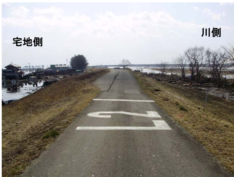
写真⑦ 現地状況(堤防) (河口から左岸2.0k付近 若林区日辺地先)