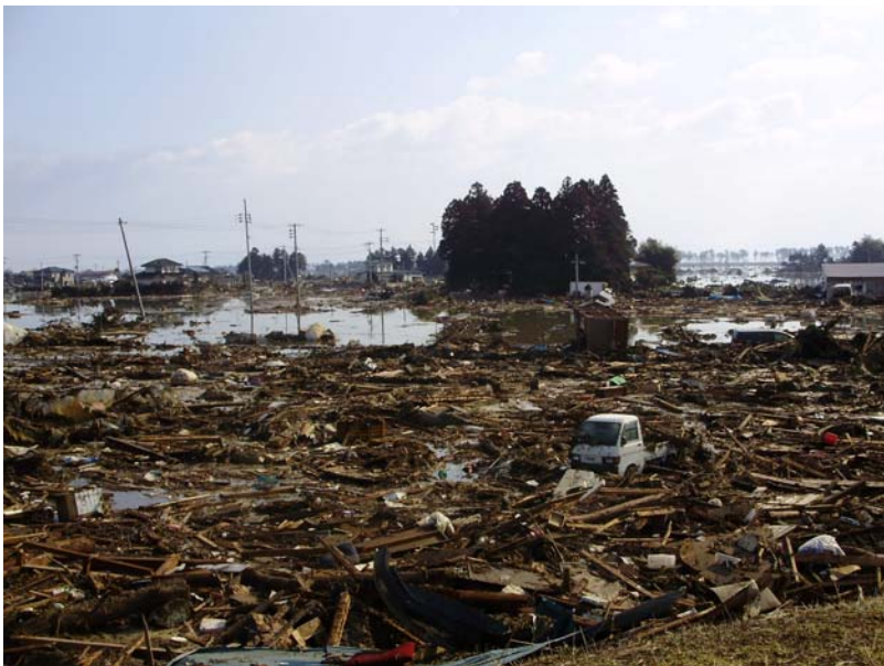
写真⑤ 現地状況(宅地側) (河口から左岸2.3k付近 若林区日辺地先)