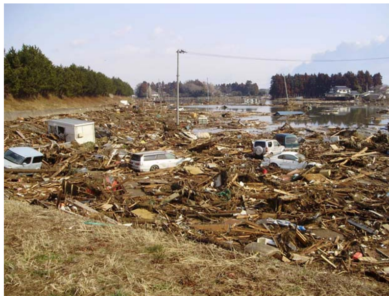
写真⑥ 現地状況(宅地側) (河口から左岸2.3k付近 若林区日辺地先)