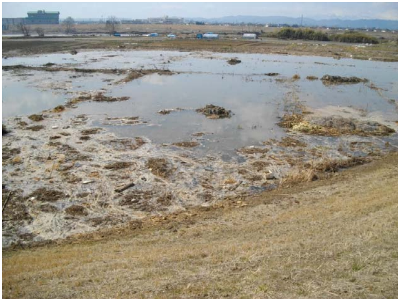
写真③ 液状化現象 (河口から左岸4.0k付近 若林区日辺地先)