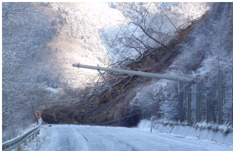
【写真③ 国道45号】 法面崩落(石巻市河北町大字成田地内) 石巻方面から気仙沼方面(北方向)を撮影