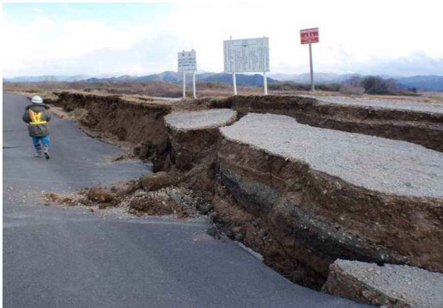
写真① 堤防沈下 (河口から右岸31.0k付近 角田市堂畑地先)