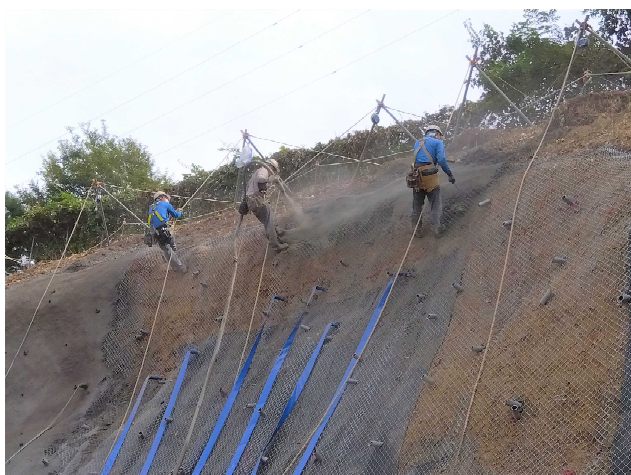
▲モルタル吹付状況（日特建設（株） 施工）