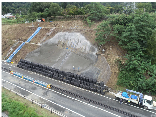
▲応急復旧作業状況