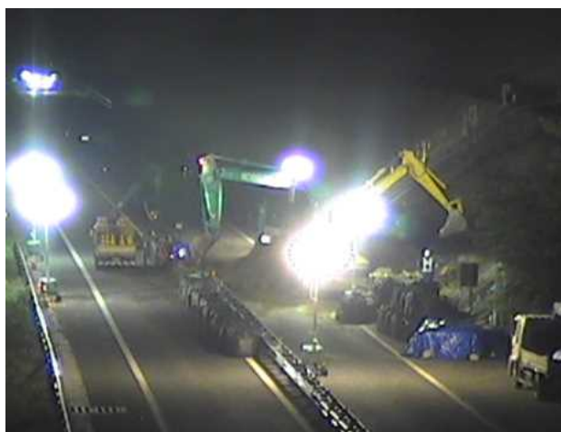
▲土砂撤去作業状況（（株）テラ 施工）