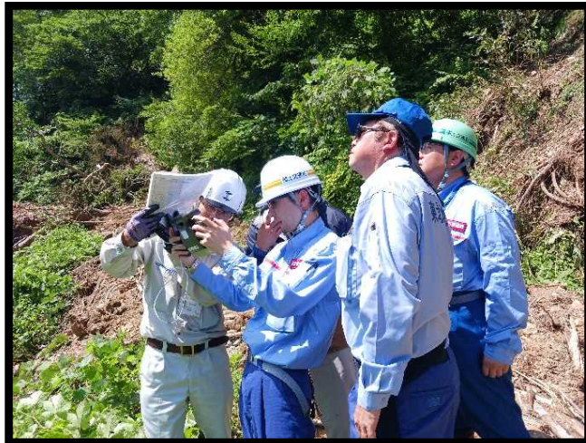
被災状況調査② (山形県鮭川村根坂地区)