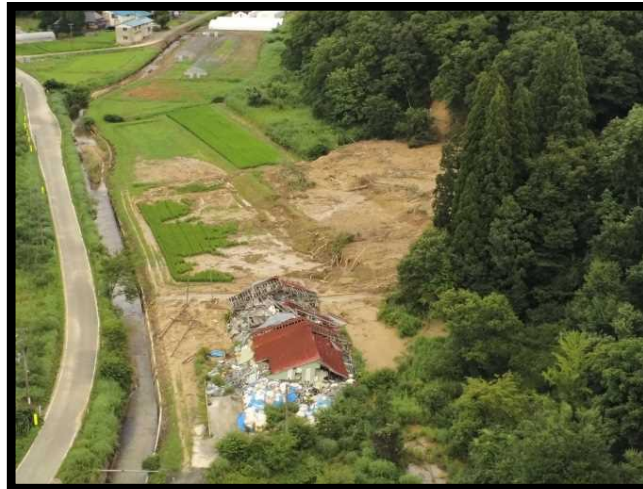
被災状況調査③ (山形県鮭川村牛潜地区)