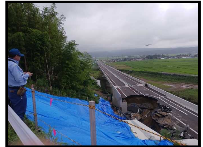
被災状況調査④ (山形県遊佐町日東道)