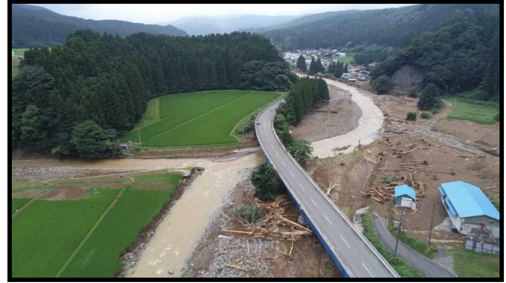
被災状況調査①(山形県酒田市 荒瀬川)