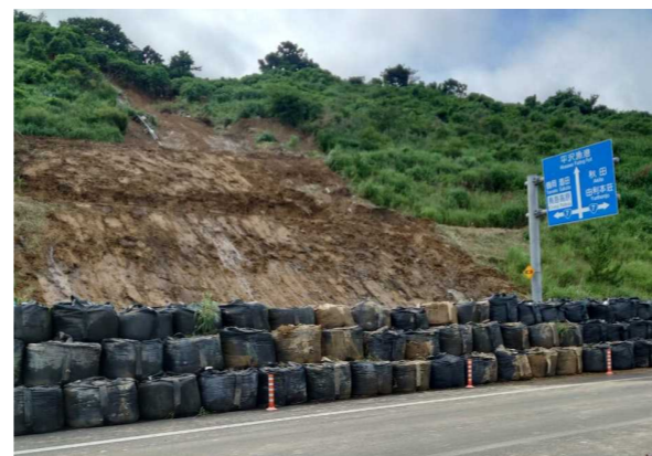
■日本海沿岸東北自動車道 仁賀保 I C 現在の状況

※E 7 日本海沿岸東北自動車道本線は、7月28日18:00に通行可能となっています。