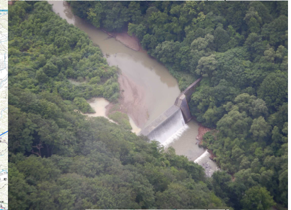
砂防施設に影響無し