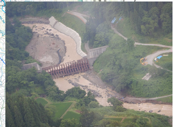
砂防施設に影響無し