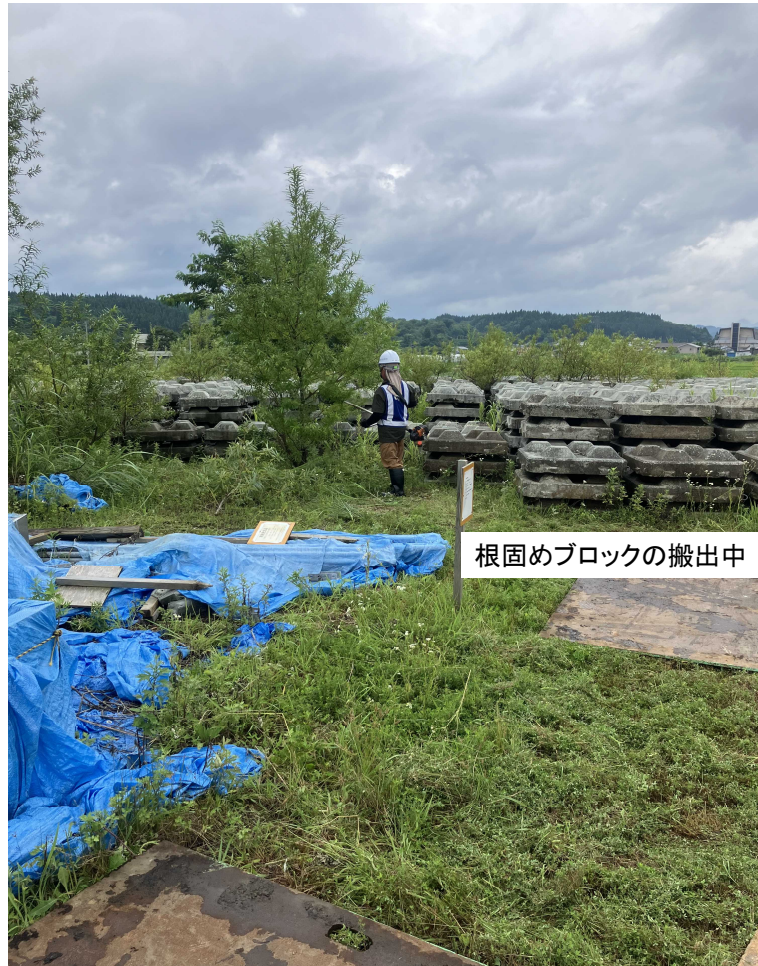
根固めブロックの搬出中