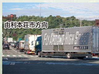
臨海十字路交差点の渋滞状況