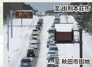
国道7号の渋滞状況