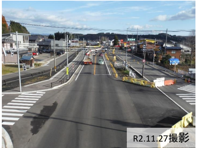
② 岡村地内(大仙市方向)