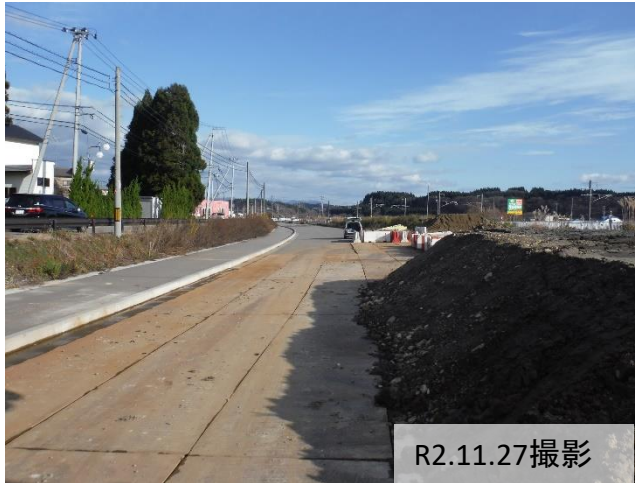
① 岡村地内(大仙市方向)