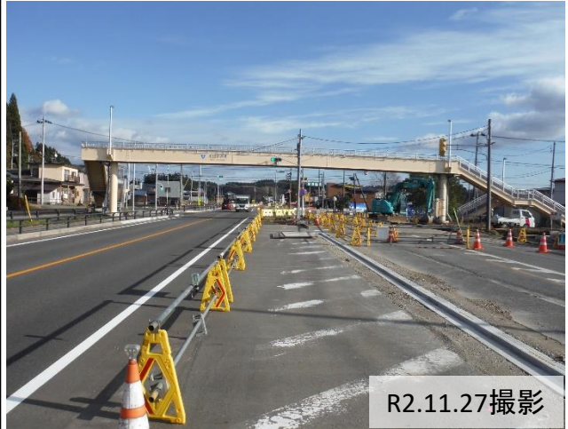
③ 下夕川原地内(大仙市方向)