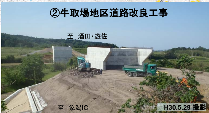
②牛取場地区道路改良工事