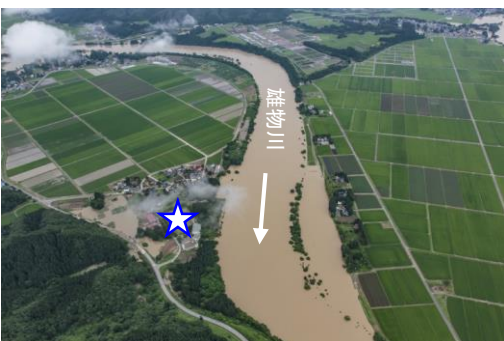
平成29年7月出水 (平成29年7月24日撮影)