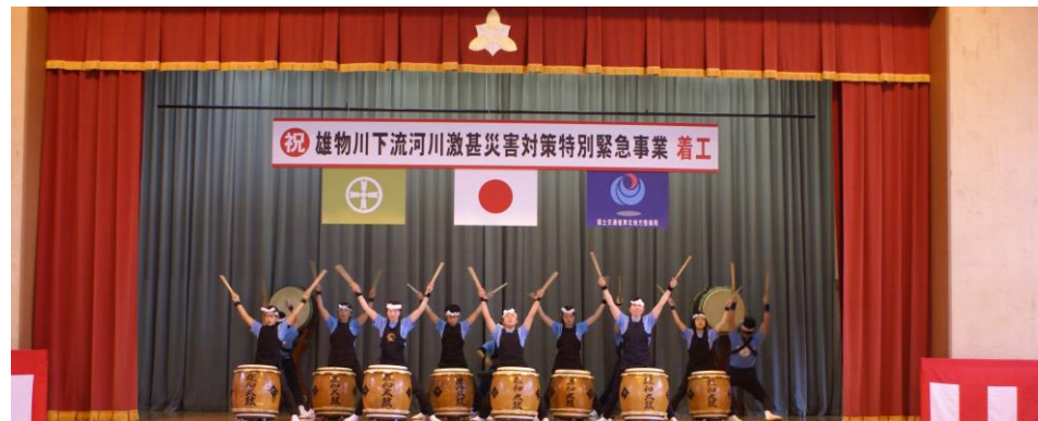
▲ 雄和太鼓保存会による演舞