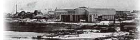
旧雄物川から見た茨島の工場群 (昭和40年)