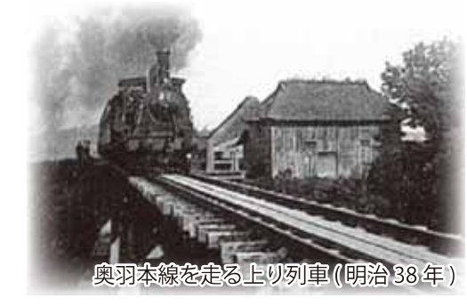
奥羽本線を走る上り列車(明治38年)