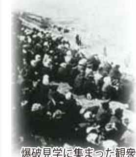
爆破見学に集まった観衆