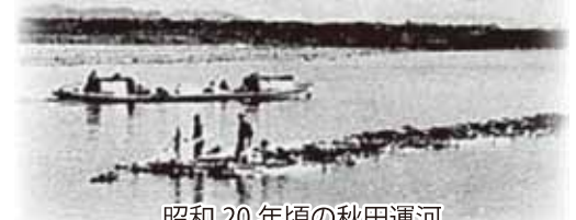
昭和20年頃の秋田運河

私が小さい時(昭和5年生まれ)には船着場は新屋側にあったが、後に茨島側に移っています。