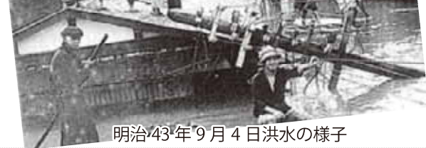
明治43年9月4日洪水の様子

築山小学校生徒時代の母の話によると、水が上がると旭川が洪水になるため、特に低い登町の子供達を町内の小舟が迎えに来て、家に帰ったとのことでした。(藤澤浩氏)