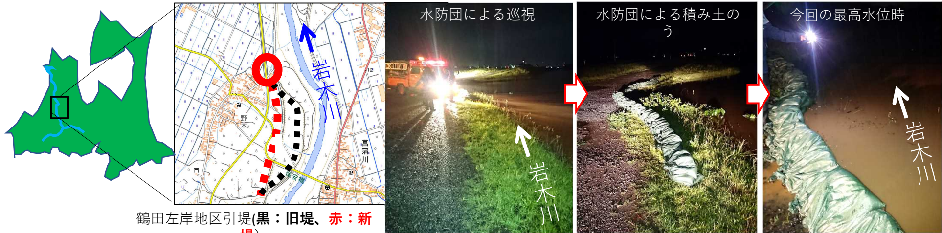
鶴田左岸地区引堤(黒：旧堤、赤：新堤)