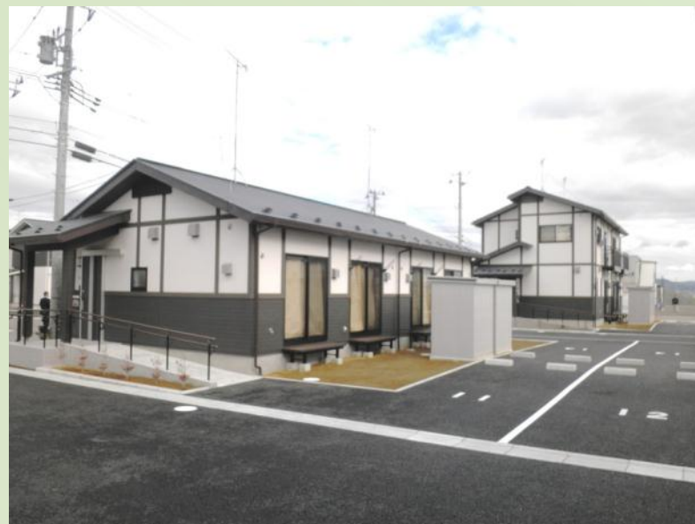
東松島市東矢本駅北地区