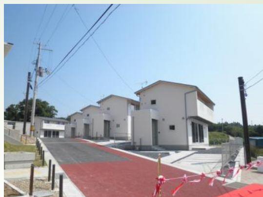
南三陸町名足地区