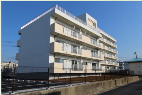
東松島市鳴瀬給食センター跡地地区