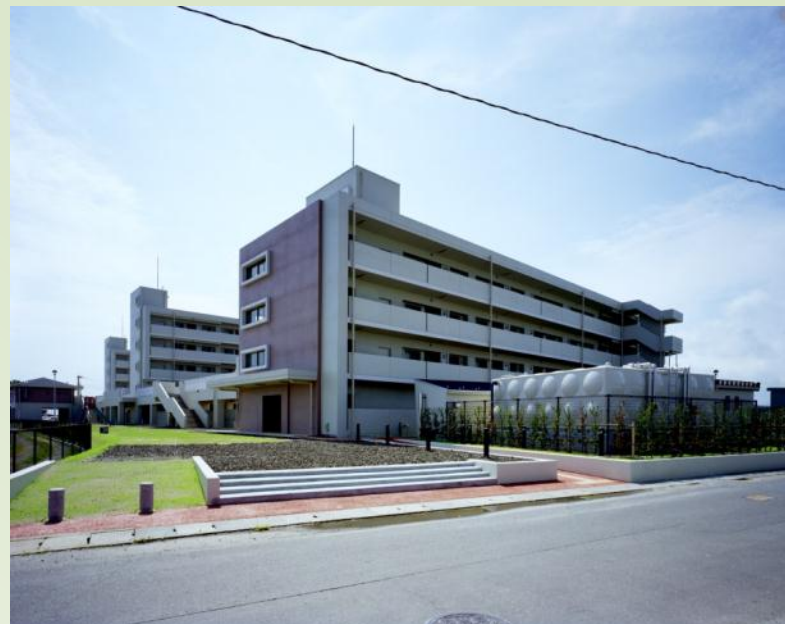
亶理町荒浜西木倉地区