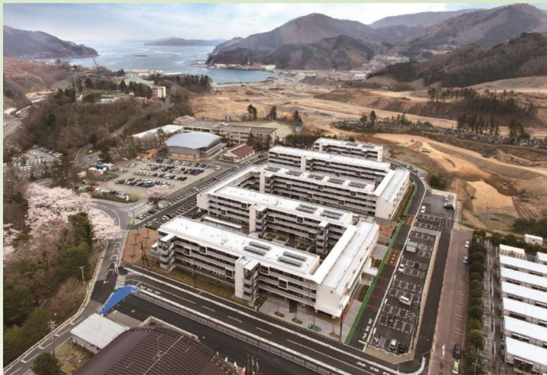
女川町陸上競技場跡地地区 (H26.10 第26回住生活月間 国土交通大臣表彰受賞 )