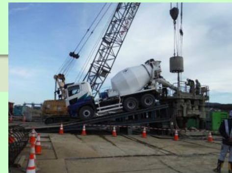
コンクリート打設状況